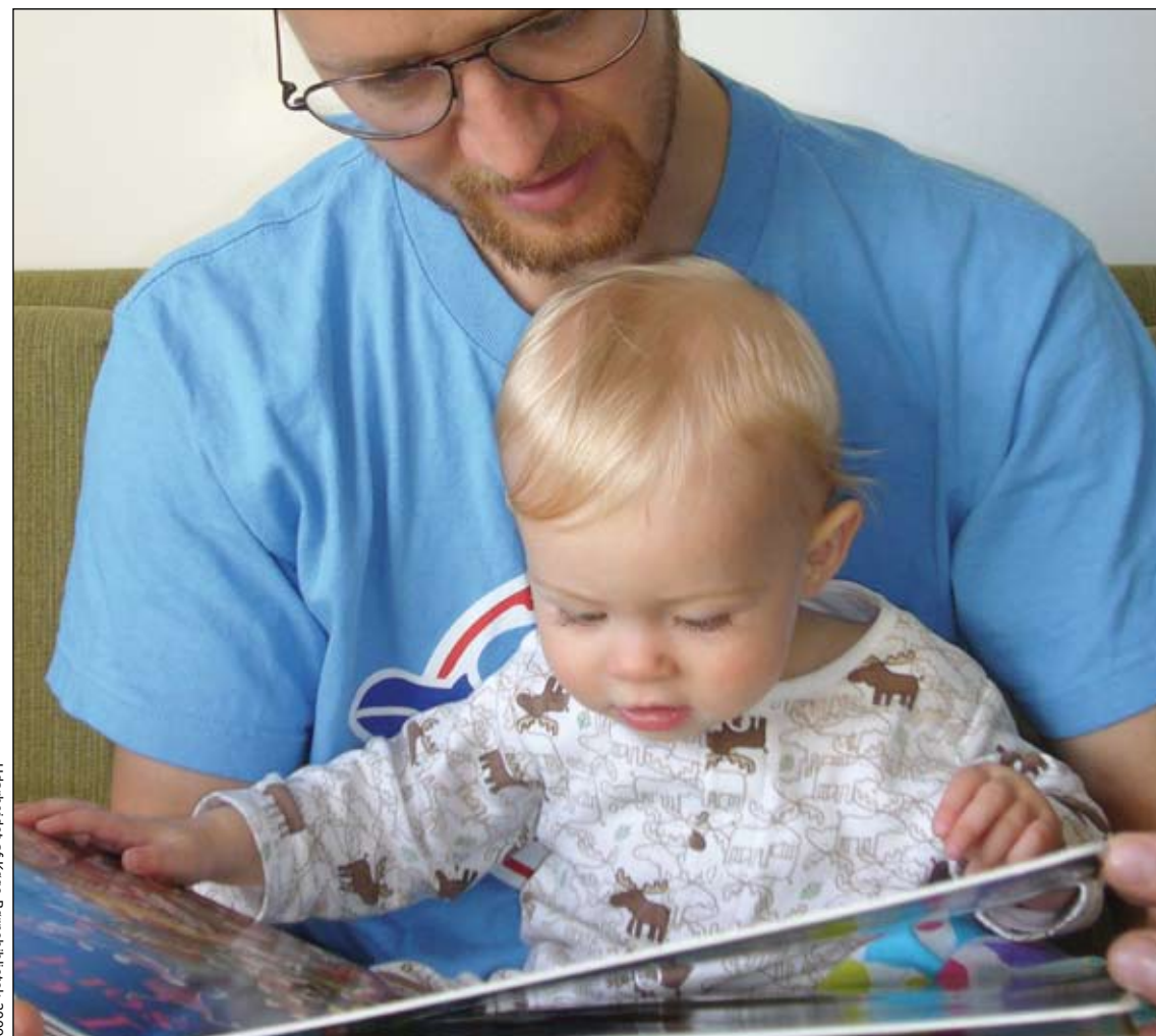
Udarbejdet af Køge Børnebibliotek 2009