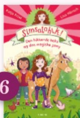
6 (Simsalahik; 1) Den hikkende heks og den magiske pony af Katja Frixe