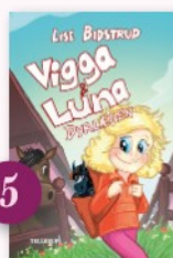
5 (Vigga & Luna; 1) Dyrlægen af Lise Bidstrup