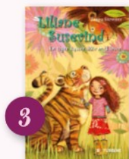
3 (Liliane Susevind; 1) En tiger kysser ikke med løver af Tanya Stewner