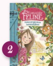
2 (Fantastiske Feline; 1) Firkløvergårdens hemmelighed af Antje Szillat