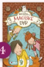
4 (Skolen med de magiske dyr; 1) Skolen med de magiske dyr af Margit Auer